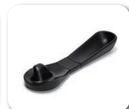
B66MAL Hemiplegie Armauflage