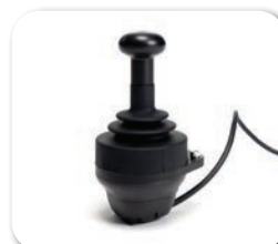
SE55 - verstärkte Steuerung