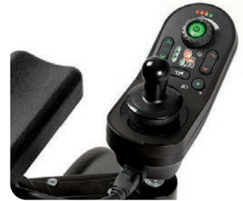
Serienmäßig mit der neuen LiNX Steuerung.

Der Forest 3+ ist ein elektrischer Rollstuhl, der speziell für große Sitzbreiten und für eine höhere Belastbarkeit bis max. 250 kg entwickelt wurde. Komplett mit modernster elektronischer Steuerung und einer Vielzahl von Optionen.