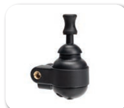
SE83 - Mini joystick