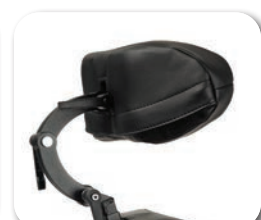
L58 - verstellbare Komfort-Kopfstütze