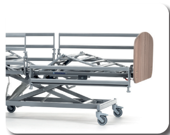
Optional mit geteilten Seitengitter