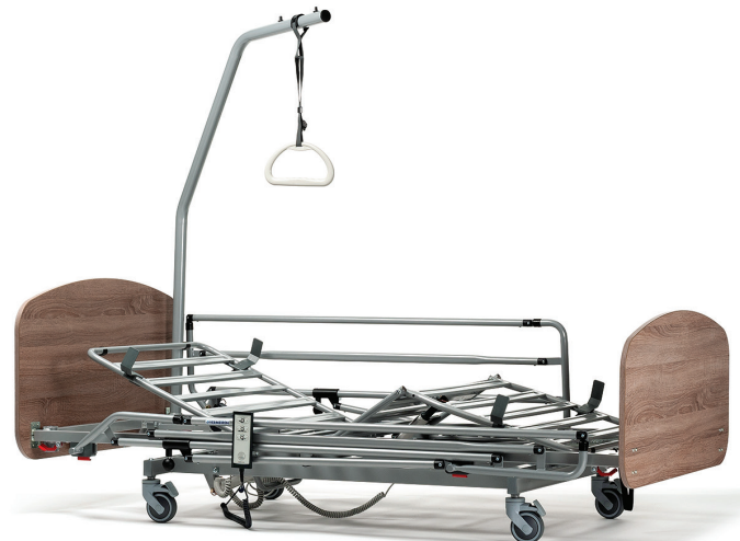
Optional mit Metall Seitengitter

Einfache und schnelle Montage, bzw. Demontage ohne zusätzliches Werkzeug, möglich durch ein sehr intelligentes Klicksystem