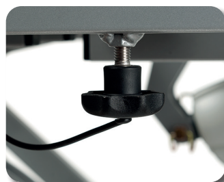
Einfache Montage und Demontage

In Bezug auf die Qualität entspricht das Illico Pflegebett den höchsten Normen, die von weltweit anerkannten zertifizierten Prüfinstituten festgelegt wurden.