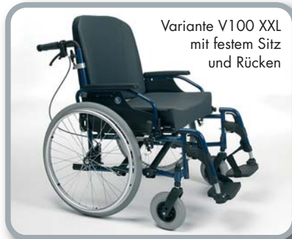
Variante V100 XXL mit festem Sitz und Rücken