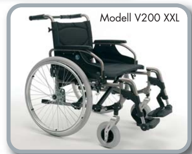
Modell V200 XXL

Mod. V300 XXL mit Anpassrücken standardmäßig