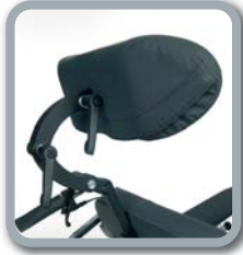
L58 - multivariable Kopfstütze