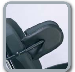
Option L04 Seitenpelotten

hochschwenkbaren Beinstützen und winkelverstellbare Fußplatten