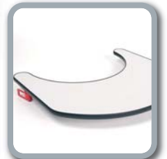
Option B12 Holztherapie Tisch